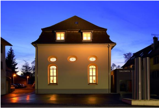
Salomon Sulzer Saal