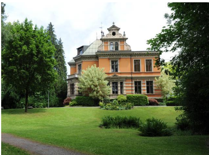
Aussenansicht Villa Claudia (Rote Villa)

(Rote Villa), Erdgeschoss, Bahnhofstraße 6