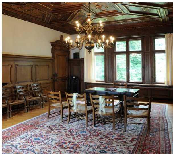
Trauraum Villa Claudia