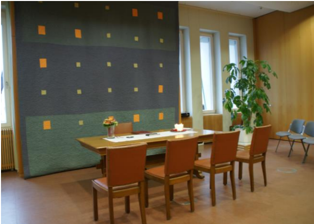
Trauraum 1. OG