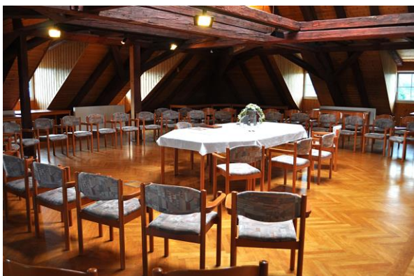
Trauraum „Alemannensaal“ in der Alten Schule

Anschrift des Trauungsräume Trauräume „Wappensaal“ und „Alemannensaal“ in der Alten Schule Kirchplatz 20, im 2. und 3. Obergeschoss Erreichbarkeit: mit Lift erreichbar Anzahl der Sitz- u. Stehplätze: ca. 60 Sitzplätze Musik: CD-Anlage und MP3-Player vorhanden; Live-Musik möglich Blumenschmuck: vorhanden; kann auch mitgebracht werden Parkmöglichkeiten: ca. 30 Parkplätze im Nahbereich vorhanden Kosten: Raummiete € 66,00 Sonstiges: Sektausschank im Haus oder Vorplatz bzw. auf dem Kirchplatz möglich, Stehische in der Alten Schule vorhanden