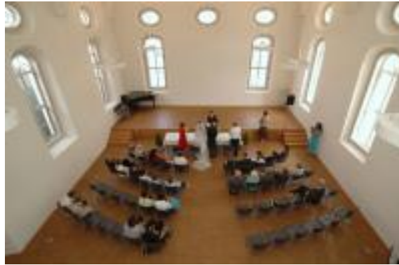
Salomon Sulzer Saal Innenansicht