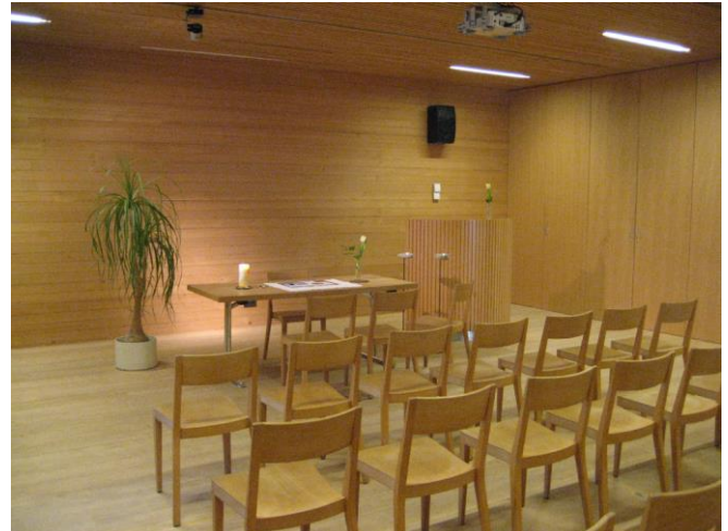
Trauraum Feuerwehr- und Kulturhaus

Anschrift des Trauungsraumes: Platz 370 Beschreibung: im 1. Obergeschoss des Gemeindeamtes Erreichbarkeit: behindertengerecht mit Lift erreichbar Anzahl der Sitz- u. Stehplätze: 20 bis 30 Sitzplätze möglich; Größere Trauungen, bis ca. 70 Personen, können im Schulungsraum des Feuerwehr- und Kulturhauses abgehalten werden Musik: CD-Anlage vorhanden; Live-Musik möglich Blumenschmuck: vorhanden; kann auch mitgebracht werden Parkmöglichkeiten: ca. 20 Parkplätze im Nahbereich vorhanden Kosten: Trauraum Gemeinde keine zusätzlichen Kosten Schulungsraum Feuerwehr- und Kulturhaus 108,00 Euro inkl. 20 % MWSt. Sonstiges: Sektausschank im Haus ist möglich!